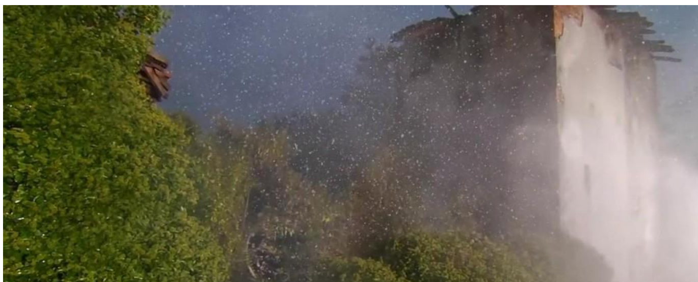
Immagine tratta dal video Movimenti di un Tempo Impossibile

L'Associazione Radicate, in collaborazione con il Comune di Albissola Marina, presenta Movimenti di un Tempo Impossibile un video di Flatform ri-sonorizzato dal vivo dal brano musicale Exotik di Carlo Chiddemi